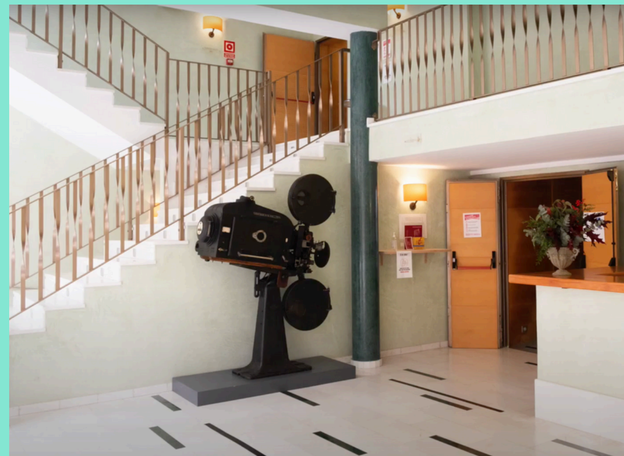
Vestíbulo del Teatro Principal de Santanyí

Gracias a la gestión de servicios del teatro por parte de la productora Tshock, los residentes pueden disponer de un espacio técnico para ensayos y pre-estrenos o estrenos. El teatro dispone de 180 asientos y un escenario de 12 x 10 m 2 , así como equipo de sonido y luz profesional.