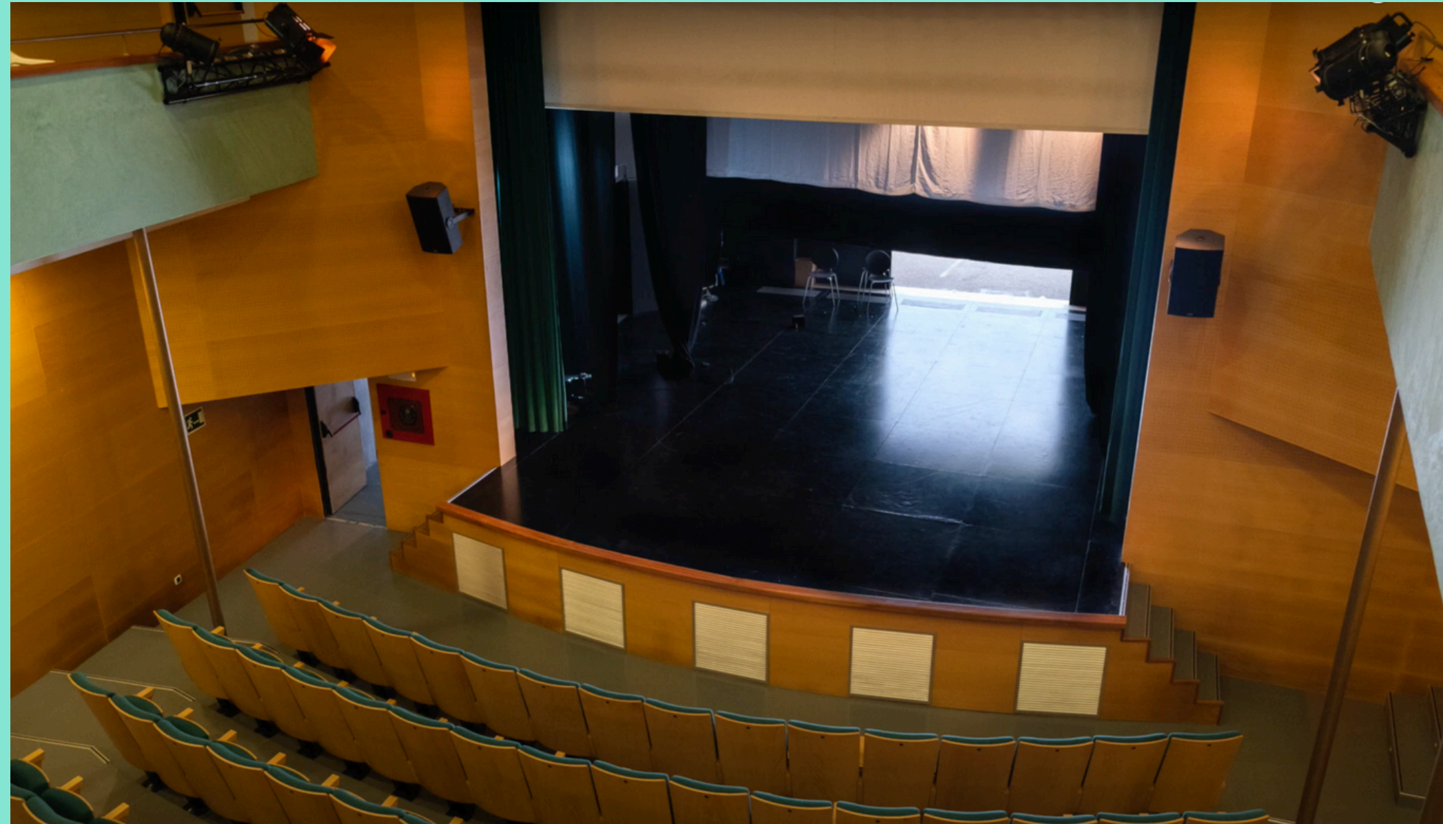
Interior del Teatro Principal de Santanyí