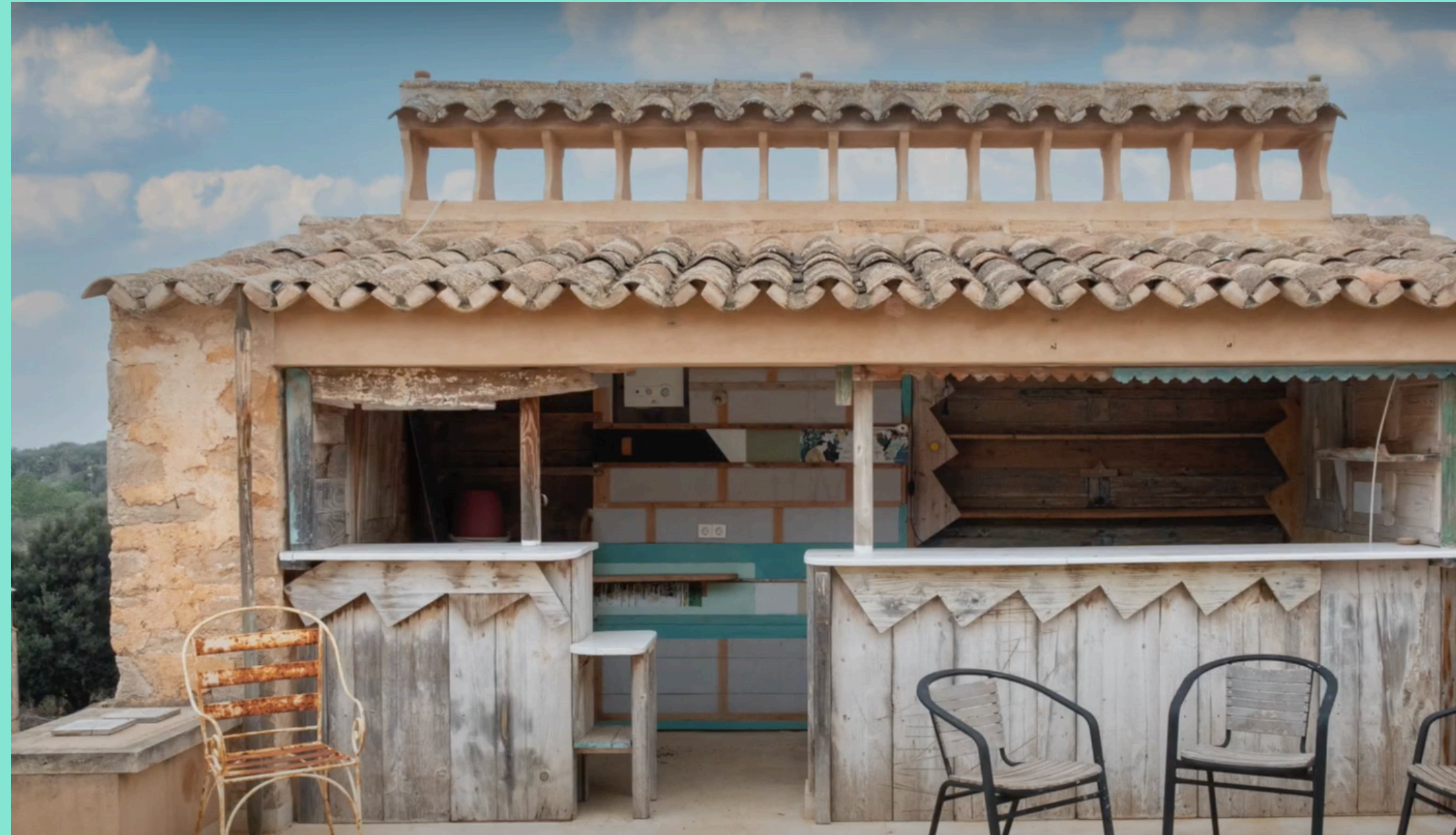
Terraza de Can Timoner