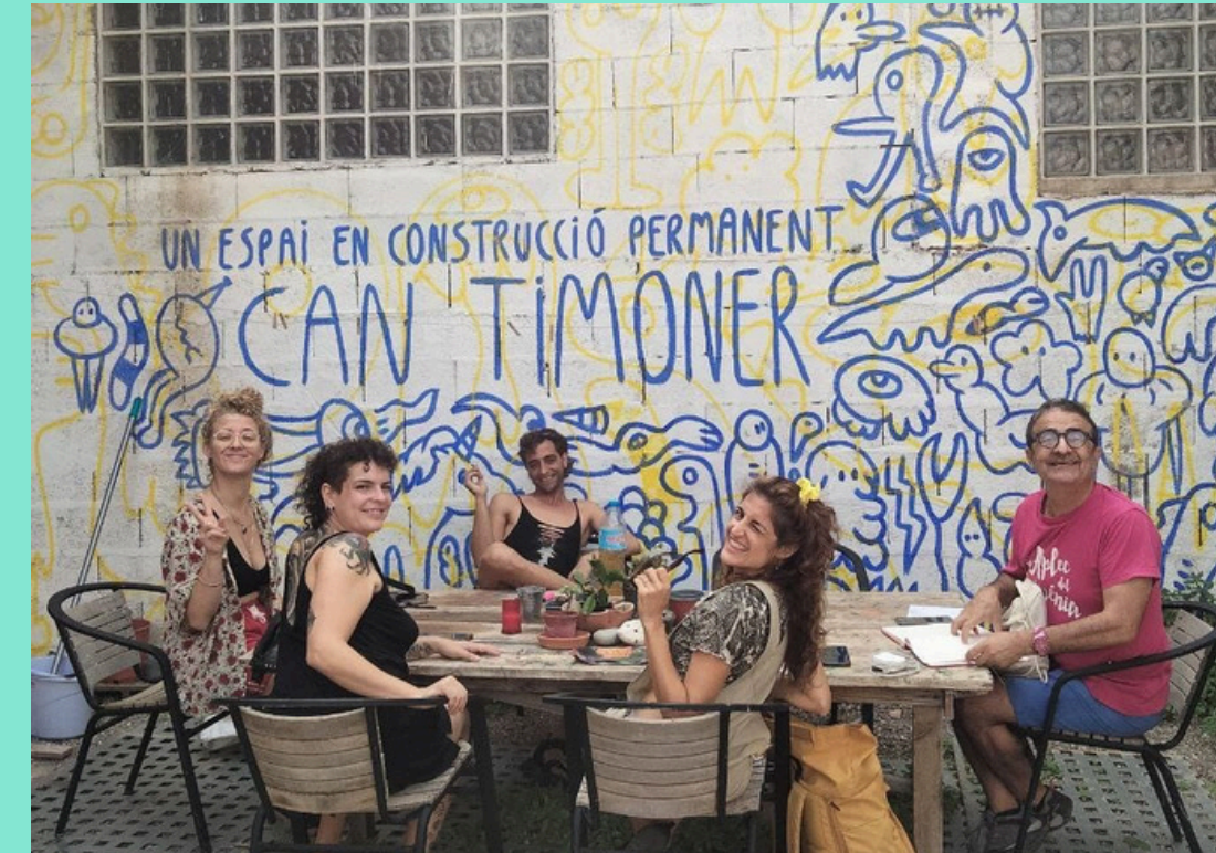
Collectiu Güilis/Colectivo Baldío

Sa Talaia gestiona residencias artísticas de producción y creación escénica a "full time" en el propio espacio, Can Timoner y el Teatro Principal de Santanyí. Tiene una trayectoria independiente que en el año 2025 cumplirá doce años y puede hospedar hasta 8 creadores en un mismo proyecto, aportándoles tanto una sala de danza, como dos salas polivalentes, y 4 espacios escénicos diferenciados. Así como residencia técnica en el Teatro Principal de Santanyí y proyección internacional de estreno mediante el Festival independiente S'Illo.