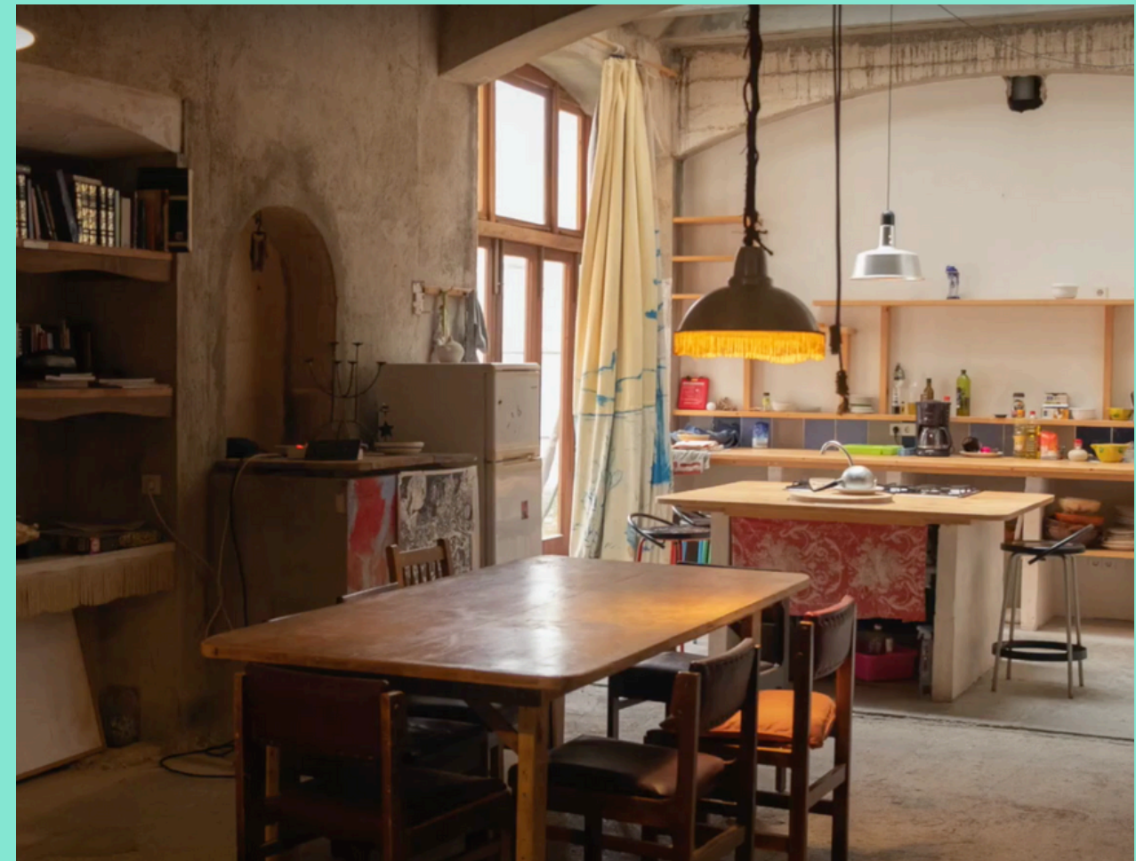
Cocina de Can Timoner

Es el espacio de alojamiento de los residentes. Se trata de un casal de 600 metros cuadrados ubicado en el centro de Santanyí. Bajo petición previa se pueden alojar hasta 8 personas. El espacio cuenta con 5 habitaciones, cocina, dos baños, tres terrazas, diferentes espacios de ocio y tres salas.