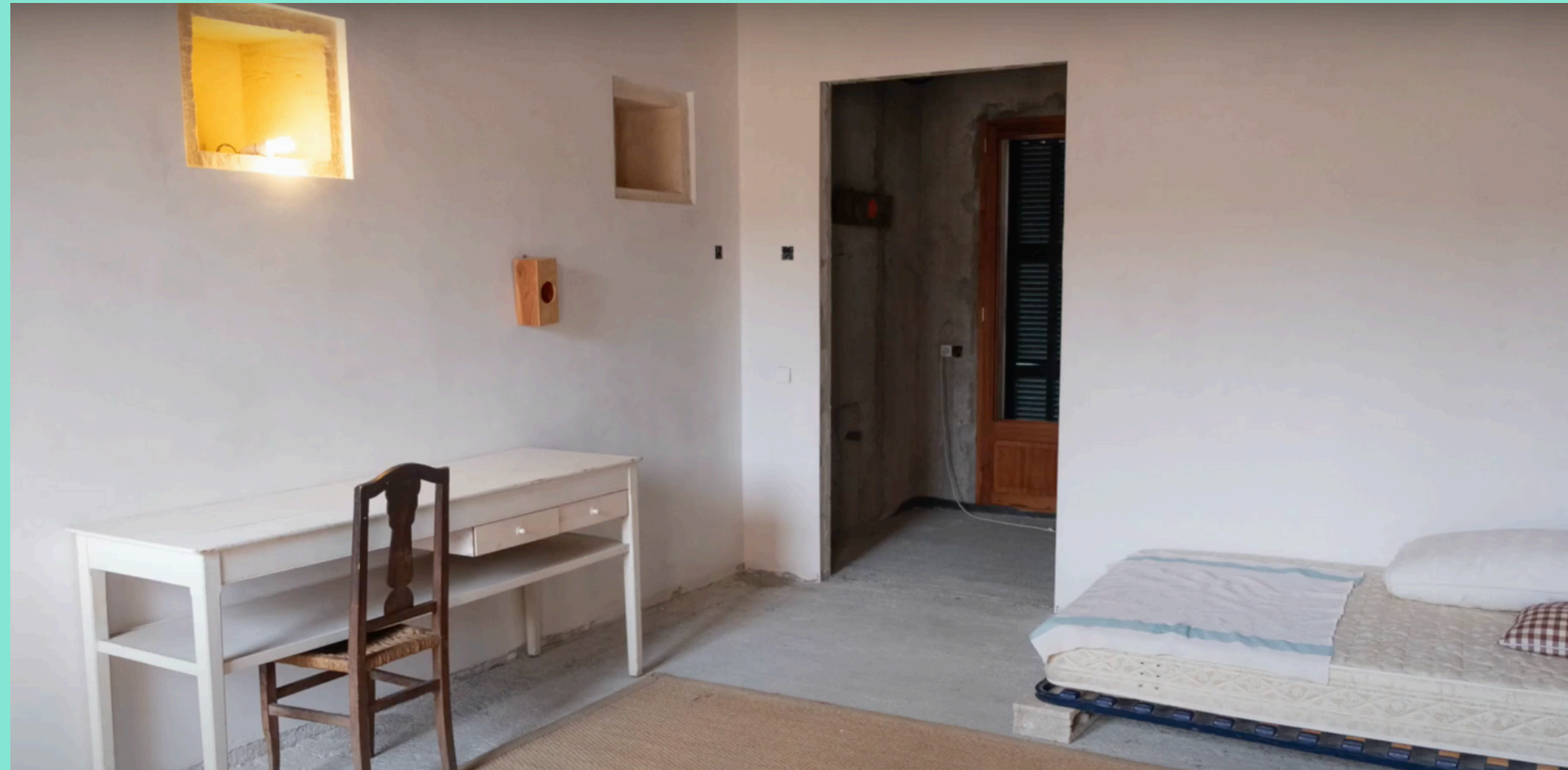
Una de les 5 habitacions de Can Timoner