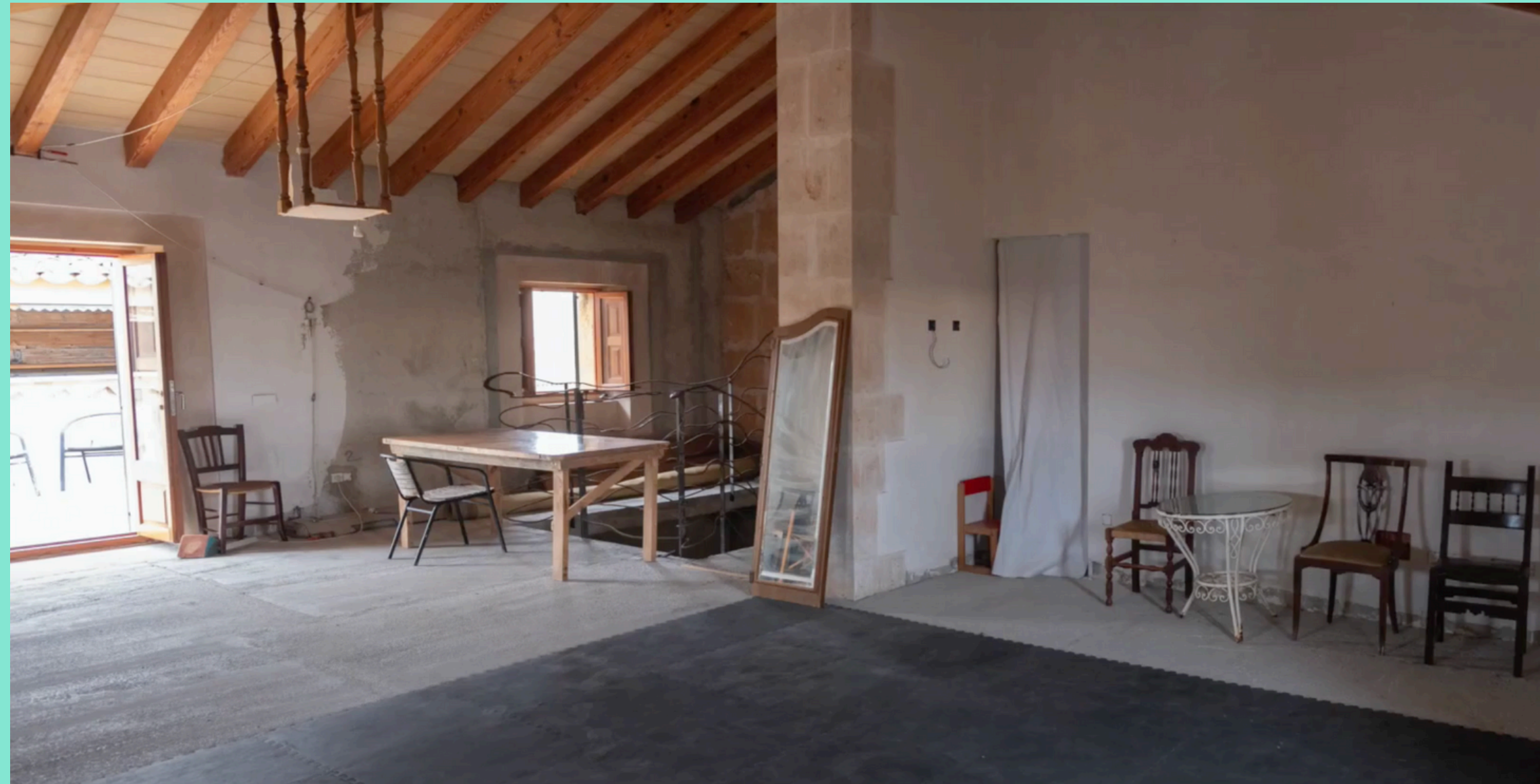
Sala de la tercera planta de Can Timoner