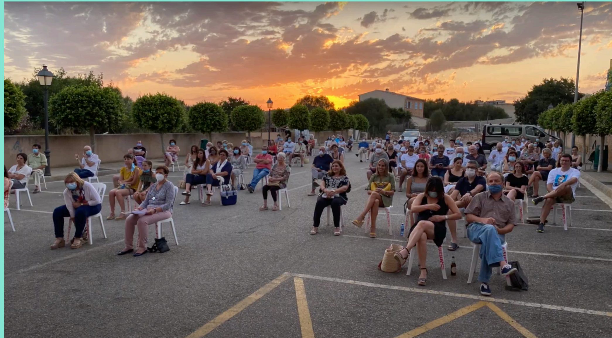
Exterior del Teatro Principal de Santanyí