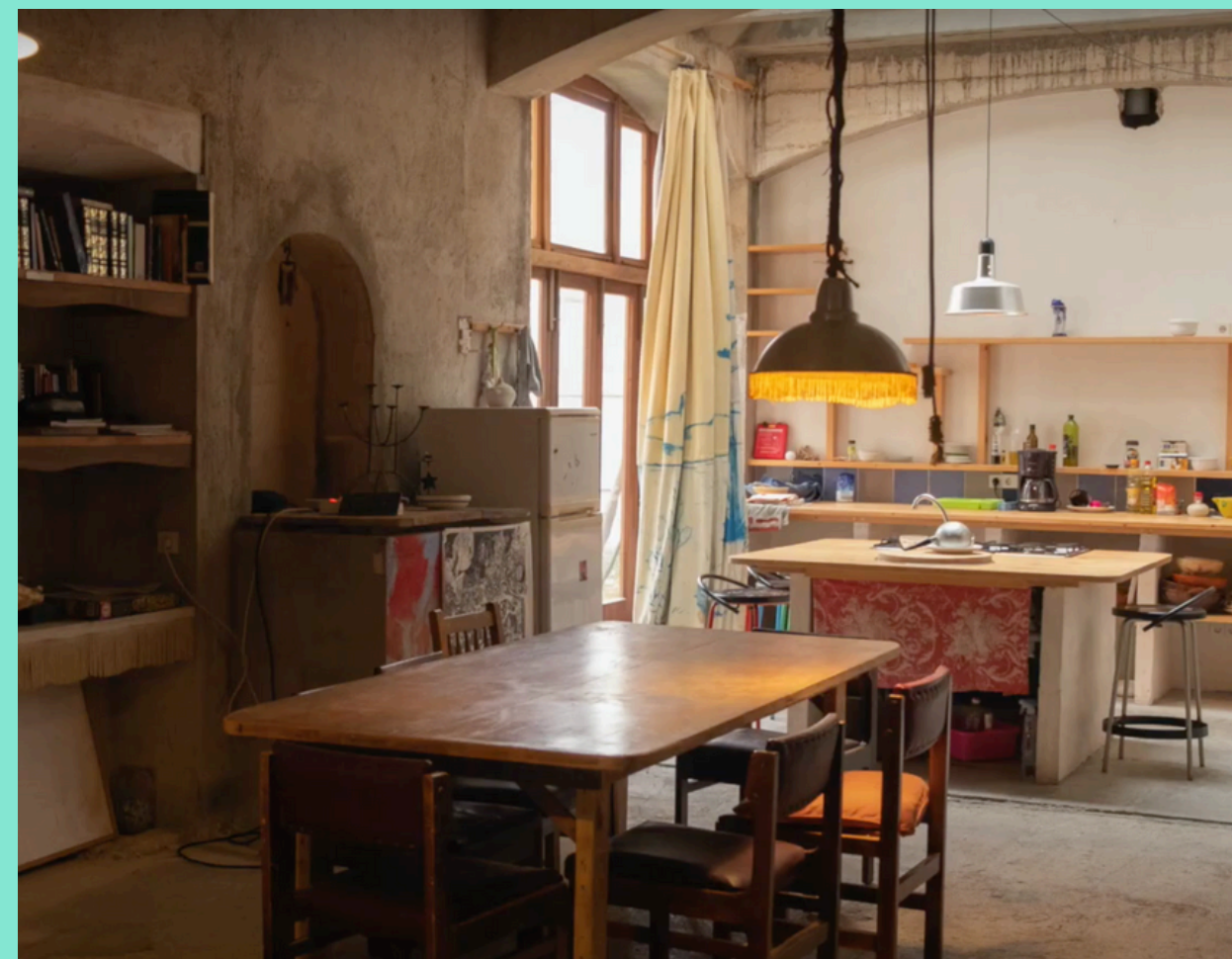
Cocina de Can Timoner

Es el espacio de alojamiento de los residentes. Se trata de una casa de 600 metros en pleno centro de Santanyí. Bajo petición previa se pueden alojar hasta 12 personas. El espacio cuenta con 5 habitaciones, cocina, dos baños, tres terrazas, diferentes espacios de ocio y tres salas.