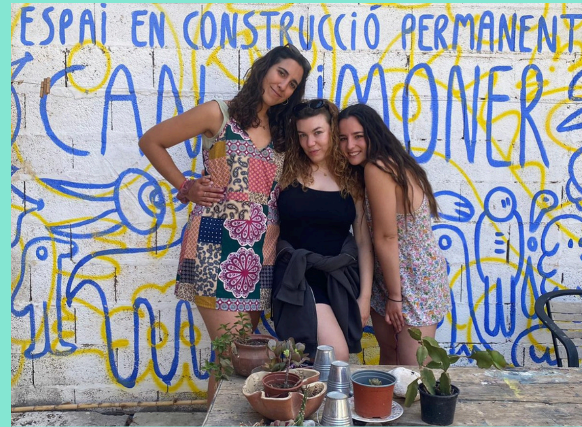
Las Reinas del Baile

Sa Talaia gestiona residencias artísticas de producción y creación escénica a "full time" en el propio espacio, Can Timoner y el Teatro Principal de Santanyí. Tiene una trayectoria independiente de once años y puede alojar hasta 12 creadores en un mismo proyecto, aportándoles tanto una sala de danza, como dos salas polivalentes, y 4 espacios escénicos diferenciados. Así como residencia técnica en el Teatro Principal de Santanyí y proyección internacional de estreno mediante el Festival independiente S'Illo.